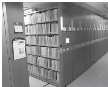
現在、一階集密書架に配架中

協会図書は今後も継続して寄贈を受けることとなっています。それにより全国の報告書はもとより、入手しにくい各地の同人誌的な雑誌が今後も揃うこととなります。日本は世界屈指の発掘調査量を誇り、考古学の成果はきわめて膨大です。本学図書館が果たす役割は日本のみならず世界の考古学においても大きいといえるわけです。